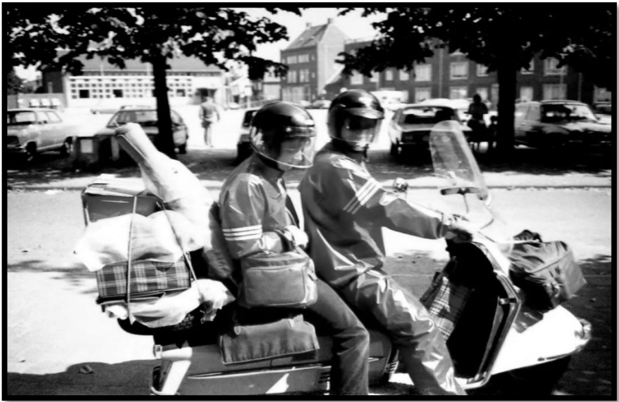
Veilig terug op de markt Beek

De volgende dag, alle bagage weer op de Heinkel stouwen en lekker rustig naar huis tuffend. Bij aankomst nog even op bezoek bij een vriend.