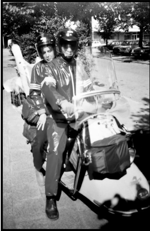
Al “slapend” lid van de Kwakel (zie sticker op neus)

Bij het afscheid kreeg ik natuurlijk een sticker van Heinkelklub de Kwakel, die ik meteen op de neus van mijn Heinkel plakte, dus ik ben al vanaf die tijd “slapend “ lid geweest van de Kwakel!!